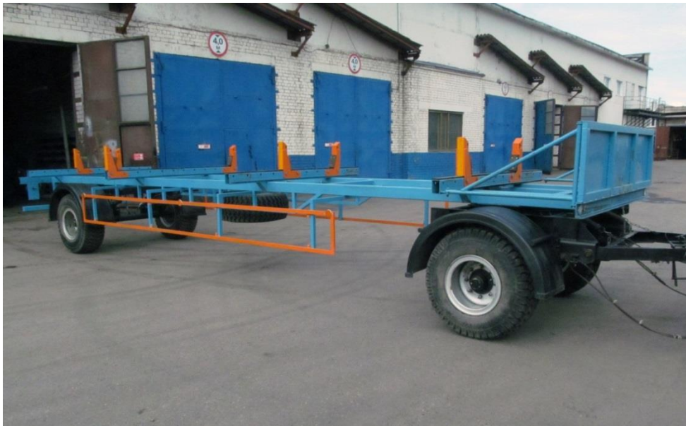
Модификация с грузовой платформой на \frac{1}{4} часть прицепа